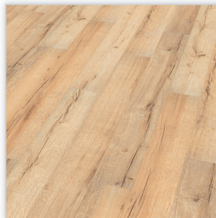
Kolekcja wineo 500 small V4, dekor Tirol Oak Cream, symbol LA043SV4. Wymiary [mm]: 1380/160/8. Wzór: pełna deska – powierzchnia Synchron (wyraźne sęki i wyżłobienia), 4-stronna V-fuga. Cechy: płyta nośna Aqua Protect, warstwa antystatyczna, klasa ścieralności AC4, montaż bezklejowy LocTec.