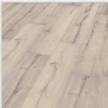
Kolekcja wineo 500 large V2, dekor Tirol Oak White, symbol LA046LV2. Wymiary [mm]: 1380/246/8. Wzór: pełna deska – powierzchnia Synchron (wyraźne sęki i wyżłobienia), 2-stronna V-fuga. Cechy: płyta nośna Aqua Protect, warstwa antystatyczna, klasa ścieralności AC4, montaż bezklejowy LocTec.