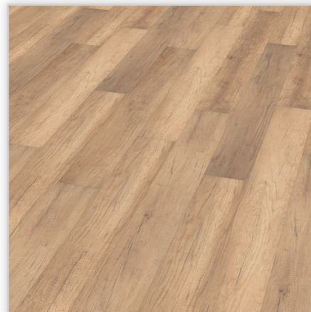
Kolekcja wineo 500 small V4, dekor Welsh Pale Oak, symbol LA008SV4. Wymiary [mm]: 1380/160/8. Wzór: pełna deska – struktura surowo-piłowana, 4-stronna V-fuga. Cechy: płyta nośna Aqua Protect, warstwa antystatyczna, klasa ścieralności AC4, montaż bezklejowy LocTec.