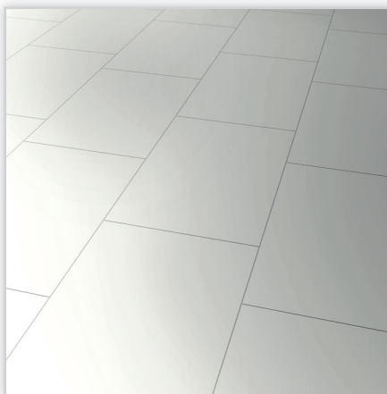
Kolekcja wineo 550, dekor biały z wysokim połyskiem, symbol LA068CH. Wymiary [mm]: 853/331/8. Wzór: dekor matowy lub błyszczący; 4-stronna mikrofaza. Cechy: wzmocniony papier dekoracyjny hartowany strumieniem elektronów; klasa ścieralności AC4, montaż bezklejowy LocTec.