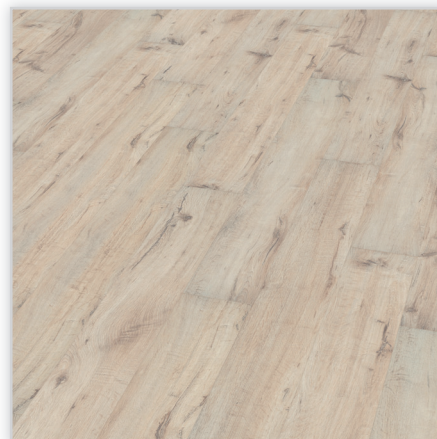
Kolekcja wineo 500 small V4, dekor Salt Oak, symbol LA047SV4. Wymiary [mm]: 1380/160/8. Wzór: pełna deska – rustykalna struktura matowa (naturalne odcienie i widoczne sęki), 4-stronna V-fuga. Cechy: płyta nośna Aqua Protect, warstwa antystatyczna, klasa ścieralności AC4, montaż bezklejowy LocTec.