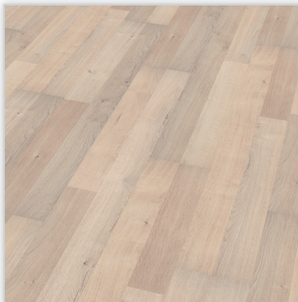
Kolekcja wineo 500 medium, dekor White Desire, symbol LA037M. Wymiary [mm]: 1288/195/8. Wzór: 2-deska – struktura klasyczna. Cechy: płyta nośna Aqua Protect, warstwa antystatyczna, klasa ścieralności AC4, montaż bezklejowy LocTec, kolekcja dostępna z podklejonym systemem akustycznym Sound Protect.