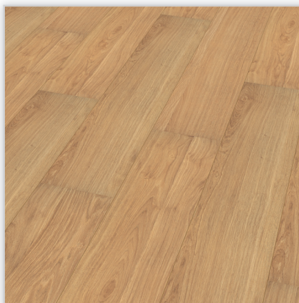
Kolekcja wineo 500 large V2, dekor Oak Champagne, symbol LA051LV2. Wymiary [mm]: 1380/246/8. Wzór: pełna deska – rustykalna struktura matowa (naturalne odcienie i widoczne sęki), 2-stronna V-fuga. Cechy: płyta nośna Aqua Protect, warstwa antystatyczna, klasa ścieralności AC4, montaż bezklejowy LocTec.