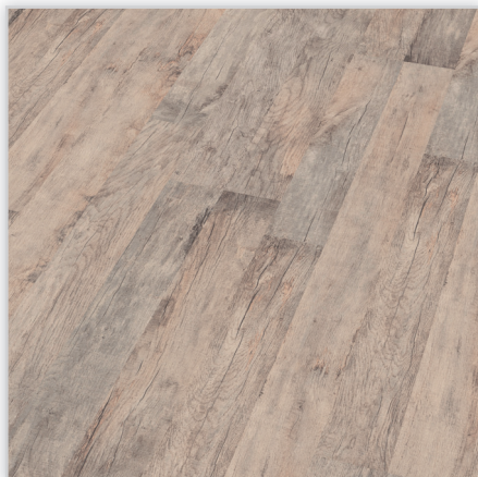
Kolekcja wineo 500 medium, dekor Storm Oak, symbol LA021M. Wymiary [mm]: 1288/195/8. Wzór: 2-deska – struktura surowo-piłowana. Cechy: płyta nośna Aqua Protect, warstwa antystatyczna, klasa ścieralności AC4, montaż bezklejowy LocTec, kolekcja dostępna z podklejonym systemem akustycznym Sound Protect.